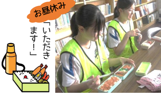
お昼休み 「いただきます!」

右のメッセージと、下のお手紙は「あぶりこ」に貼ってあります。ぜひ、ご覧にお越しください。