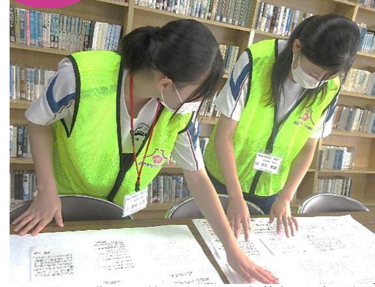
その他にも職員と一緒に活動をし、午前中の仕事が終わりました。

青陵中3年生からのメッセージ(「さくらっこのつづサロンと青陵中3年生との交流会」)を掲示する仕事をしてくれました。